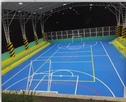
Colegio Metropolitano Del Sur