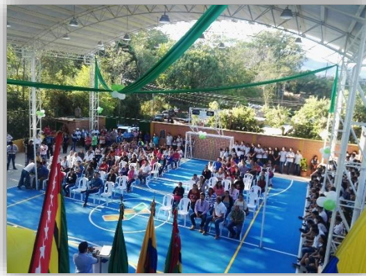
Colegio Ecologico Sede J Valle De Ruitoque