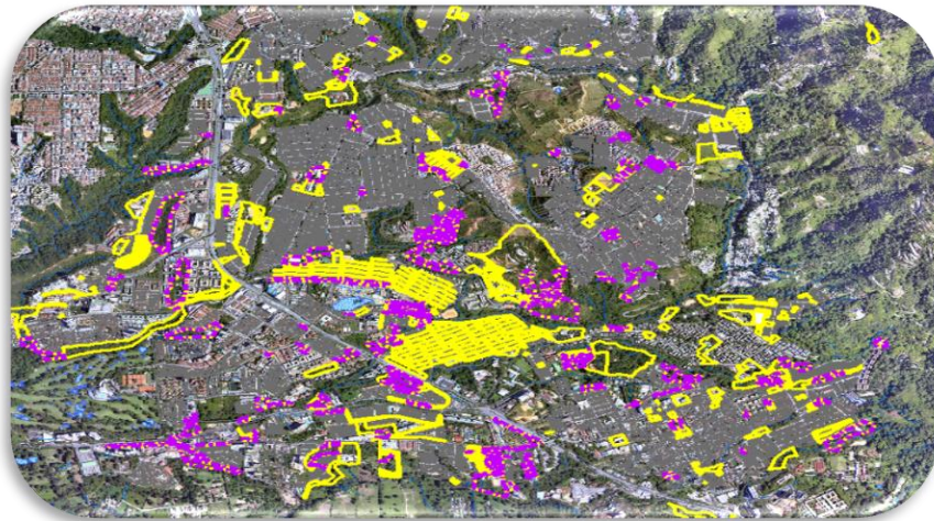
Mapa 3. Base cartográfica de los predios de propiedad del Municipio de Floridablanca

Posteriormente, durante la vigencia 2017 se celebró Contrato de Obra Pública No. COP-001-2017 para la Construcción de cerramientos perimetrales para la protección de áreas de cesión en el Barrio Altos de Villabel y en el Carmen junto al Recodo de la Florida. Por otra parte, se realizó el pago inherente de áreas de cesión Tipo A Constructora Habidad de los Andes.