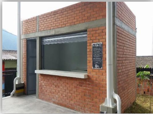
Instituto Duarte Alemán