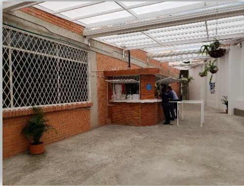
Colegio Jose Antonio Galan Sede A