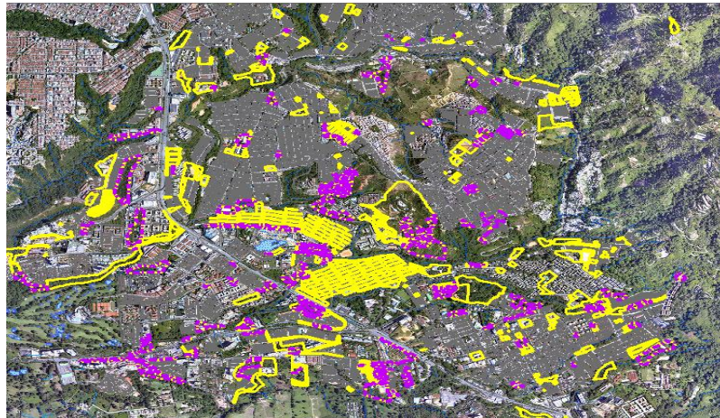
Base de datos para la visualización de los predios del municipio de Floridablanca, en el Software GEOTAC.

Contratación de personal para el seguimiento y alimentación de la base de datos mediante contratos de prestación de Servicios No. T-001-2017/P-017-2017/P-018-2017/ 006, 007, 012, 014 de 2018