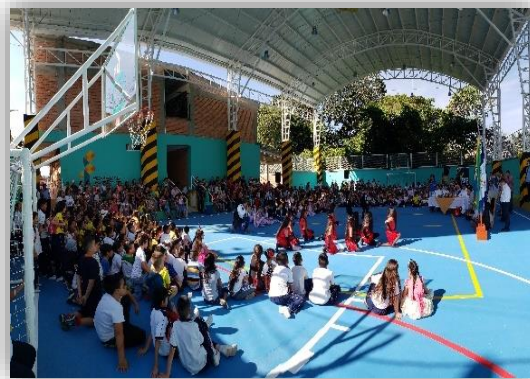
Colegio Jose Antonio Galan Sede B