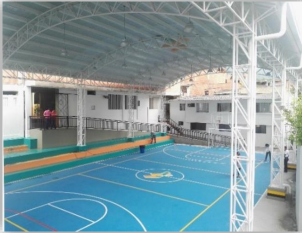
Colegio Gonzalo Jiménez Navas Sede A