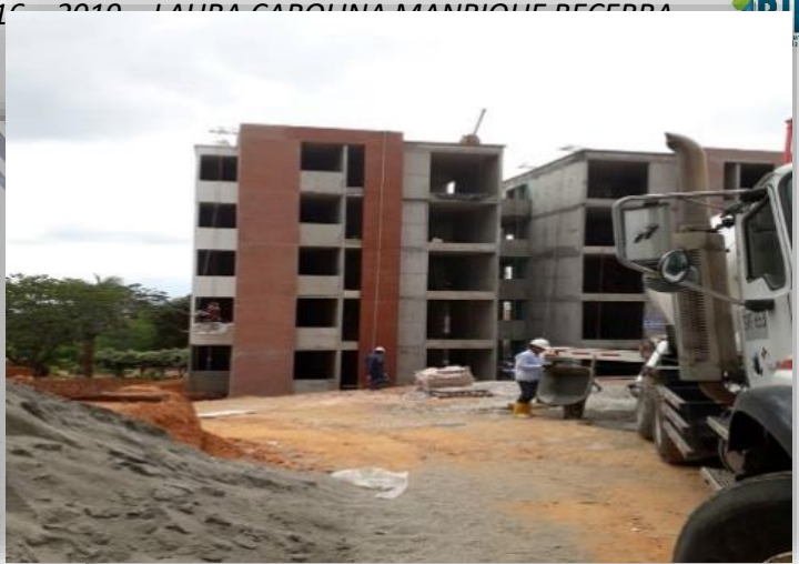
Vivienda "Villa Renacer"

Meta de Producto No. 137. Formular, diseñar e implementar una política pública de vivienda.